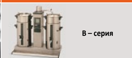
В – серия